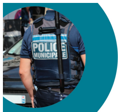
Panorama de la police municipale des Villes de France